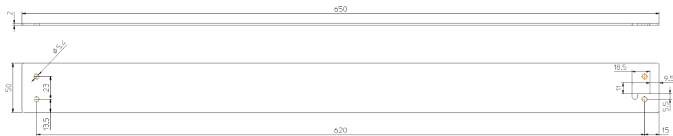
Abmessungen PK00578 (VBlech 600) Material Edelstahl