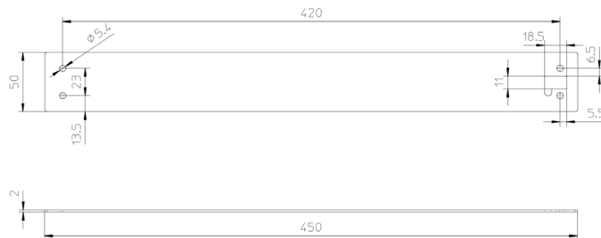
Abmessungen PK00594 (VBlech 400) Material Edelstahl